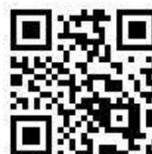
中居小 HP QRコード